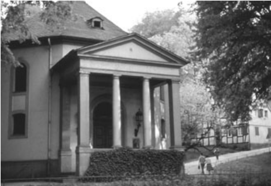
Die Gnadenkirche (im Hintergrund die ehemalige Grundschule), um 1955