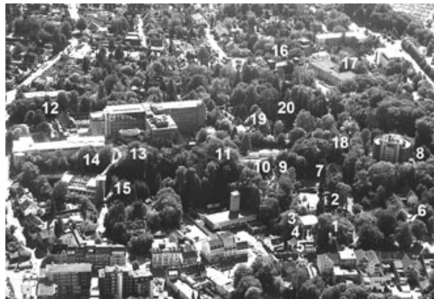
„Von der Wiege bis zur Bahre.“ Der Quirlsberg in Bergisch Gladbach heute: