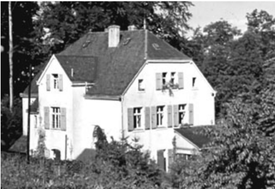
Das Pfarrhaus am Quirlsberg, um 1955